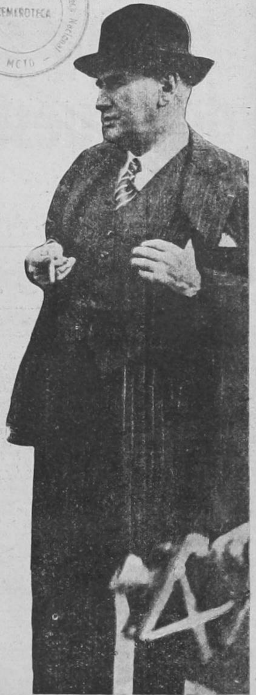
Premier Eduardo DALADIER

Ampliamente confirmadas las informaciones cablegráficas de LA TRIBUNA anunciando el fracaso de la huelga